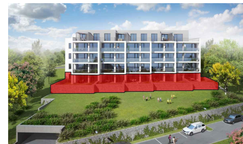
VIZUALIZACE (POHLED Z JIHU)